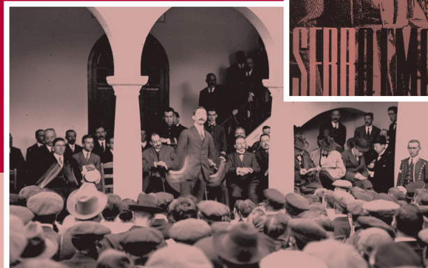
Inauguració del nou edifici municipal (Pineda de Mar, 1917)