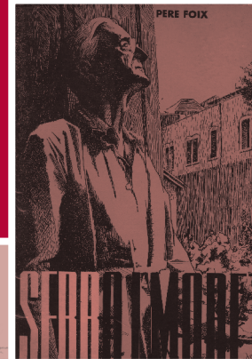
Llibre de Pere Foix