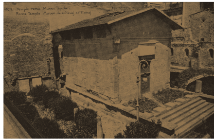
El Temple Romà abans de la restauració definitiva